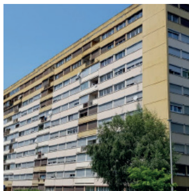
Copropriété A (avant travaux)