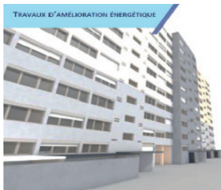
TRAVAUX D'AMÉLIORATION ÉNERGÉTIQUE