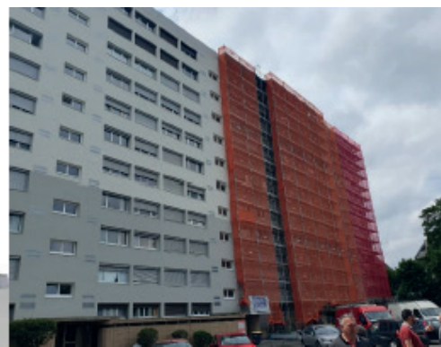
Avancée des travaux au 04.05.2024