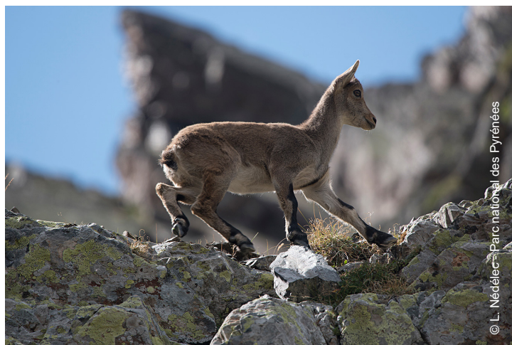
▲ Chiva, première cabri née sur le territoire du Parc national le 15 mai 2015