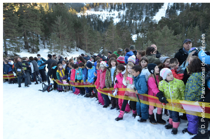
▲ Les élèves prêts à accueillir les bouquetins à Cauterets