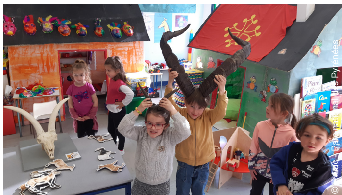
▲ Intervention en classe maternelle - Luz 2023

Pour cela, les gardes-moniteurs ont mené des interventions portant sur la biologie et écologie de l'espèce puis sur le programme de réintroduction (pourquoi réintroduire le bouquetin ? D'où viennent les animaux, la méthode et les outils de suivi) et enfin sur le suivi de la population : outils et méthode - cartographie, gps, appareil photo automatique, etc.