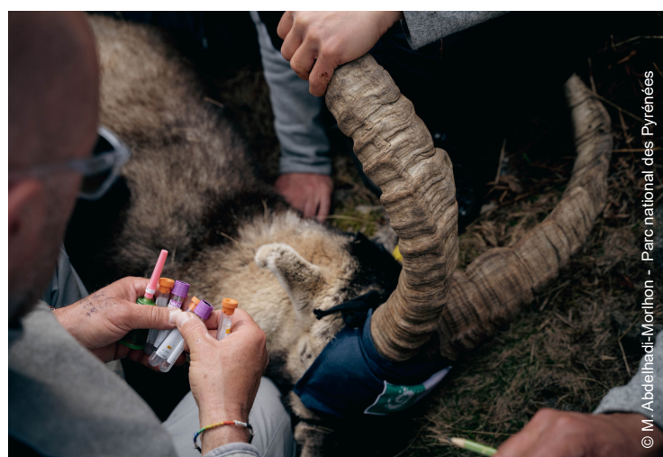
▲ Prélèvement sur un mâle en vue du suivi sanitaire

Le suivi des ongulés ainsi réalisé Par le Parc national a permis de constater le bon état sanitaire des animaux : les dix bouquetins capturés en 2023 étaient exempts de maladie.