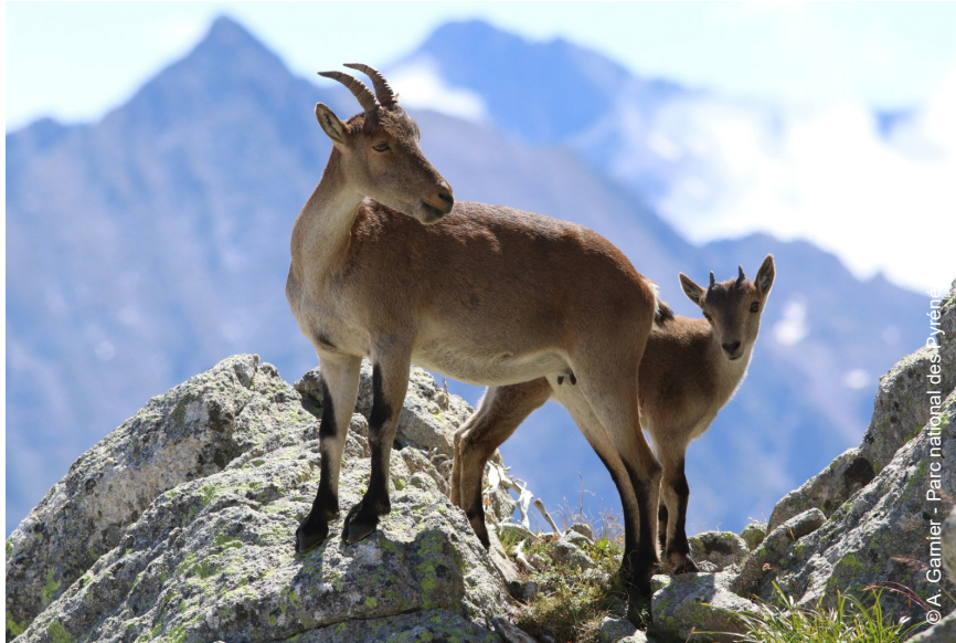
▲ Femelle et son petit