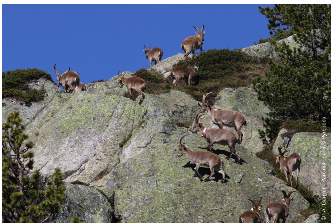
▲ Mâles sur les crêtes