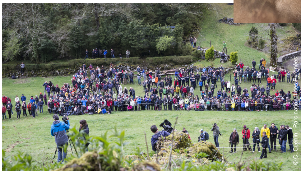
▲ Scolaires et grand publics réunis pour assister au 1er lâcher en vallée d'Aspe