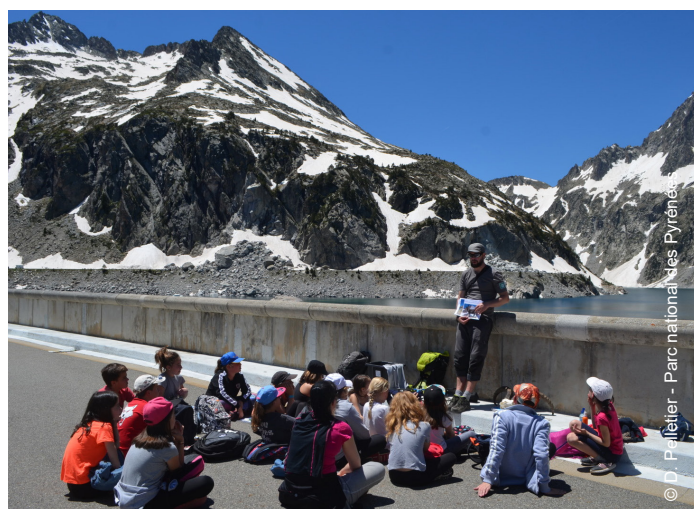
▲ Sensibilisation des élèves du collège d'Arreau - Cap de Long - 2018