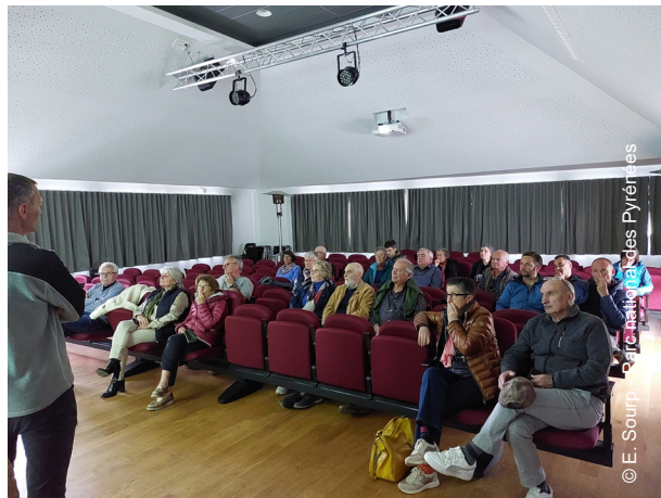
▲ Réunion d'information en vallée d'Aure

En vue d'une appropriation de la venue de cette nouvelle espèce par tous, des nombreuses réunions de concertation ont été menées à l'hiver 2023-2024, avec les élus et les représentants des agriculteurs et des chasseurs de la haute vallée d'Aure. S'en sont suivies des réunions publiques avec les habitants. Le bouquetin est attendu avec impatience par la majorité des acteurs locaux.